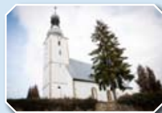
Kościół pw. św. Wawrzyńca w Dziwiszowie