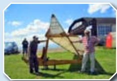
Zabytkowy szybowiec „Grunau Baby”