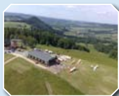
Góra Szybowcowa (Szybowisko)