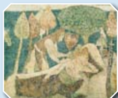
Fragm. malowidła ściennego

Złot starych szybowców „Grunau Baby”, Rowerowe „Łysogórki”, Country Cross–Motocross, Ogólnopolskie marsze na orientację, zawody narciarskie, biegi Runextreme Ledwie Dycha, zawody modelarskie „Bitwy powietrzne”.