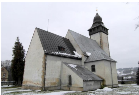
pocz. XIV w., pocz. XVI w., XVI/XVII, 1700 r.

Kościół wzmiankowany w 1399 r., obecna budowla pochodzi z pocz. XVI w., wzniesiona zapewne na miejscu starszej. Budynek orientowany, nawa trójprzęsłowa, z węższym i niższym prezbiterium dwuprzęsłowym. W na osi fasady wieża na rzucie kwadratu, zwieńczona drewnianym gankiem nakrytym baniastym hełmem z 1915 r. Od pn. barokowa kaplica z XVIII w., od pd. - kamienna kruchta z 1915 r.