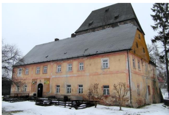
Oficyna, 2 poł. XVIII w.