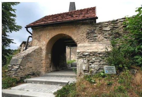
Brama w murze cmentarza przykościelnego