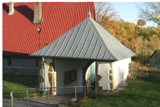
Brama na cmentarz

Kościół wzniesiony w 1 ćw. XV w., przebudowany w XVIII w.; remontowany w pocz. XX w., 1965 r., w latach 1980 - 81 i 2012 r. Owalny cmentarz przykościelny otoczony murem, z bramą o ostrołukowym prześwicie - XIV w., 2 poł. XIX w.