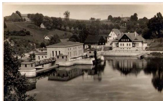
Elektrownia we Wrzeszczynie, pocztówka z l.30. XX w.