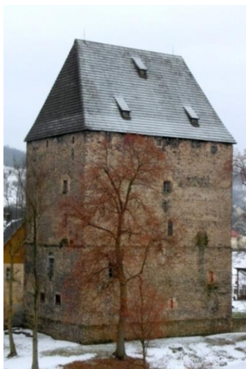
Wieża rycerska, pocz. XIV w., k.XVI